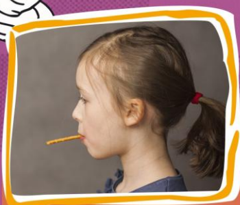
1. Jedzenie „Stonych paluszków” bez przytrzymywania ich dłonią.