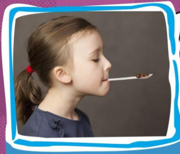
2. Trzymanie zębami i wargami lekkich produktów na małej plastikowej łyżeczce.