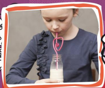
5. Picie jogurtu lub gęstego soku przez „zakręcone” słomki.