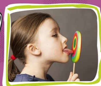
3. Lizanie czubkiem języka dużych lizaków lub lodów, ale nie lodów na patyku typu „Bambino”.