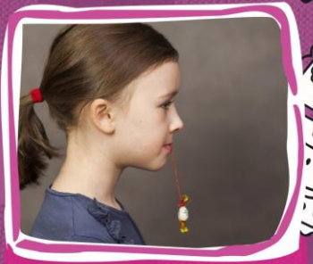
4. Trzymanie wargami i zębami nitki z zawiązanym na jej końcu małym cukierkiem.