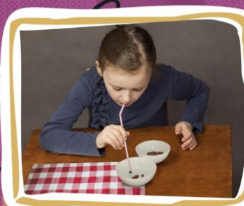
6. Przysysanie i przenoszenie za pomocą słomki różnych produktów spożywczych z jednej miseczki do drugiej, począwszy od najbliższych, np. kulek czekoladowych. Słomka powinna być przytrzymywana środkiem ust i nie powinna być przygryzana. Przenoszone przedmioty powinny być większe niż średnica słomki, by dziecko się nimi nie zachłysnęło! Po wykonaniu ćwiczenia dziecko w nagrodę może np. zjeść kulki.